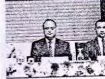
মিটেড-এর 'বার্ষিক বিক্রয় নাজ্জাতিক সম্মেলন কেন্দ্রে বছর বাংলাদেশের ঔষধ বিক্রয় প্রবৃদ্ধি অর্জন করে যে রেখেছে। আইএমএস এর প্রতিষ্ঠানটি বিক্রয়ের দিক র চাহিদা মিটিয়ে প্রতিষ্ঠানটি ক্ষতি