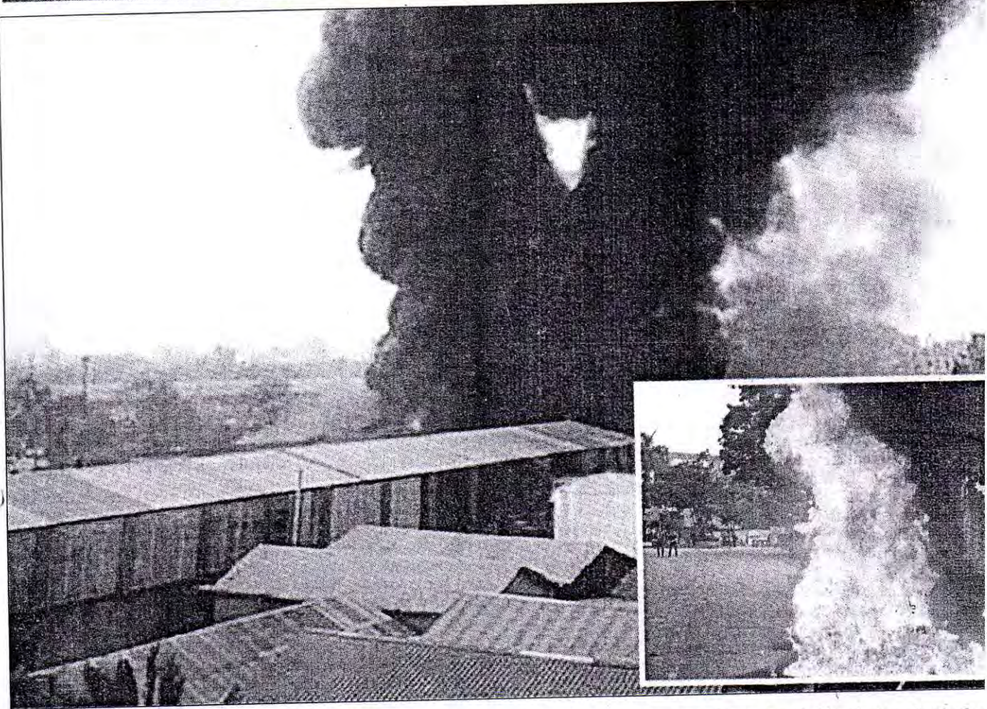
A worker was killed and 28 others burned as fire broke out at a plastic factory in city's Keraniganj. Three motor-cycles were torched by the miscreants near Jatiya Eidgah Maidan on Wednesday.

International Foreign interference in US elections 'unacceptable': Pompeo Page 8