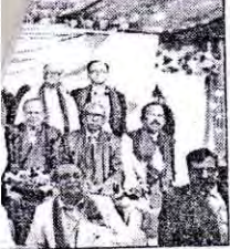
বিশ্ববিদ্যালয়ের প্রাক্তন জন শিক্ষার্থীদের সংগঠন য়শন। গত ৯ই ডিসেম্বর নর্ধনা সভায় প্রধান অতিথি য়ক মন্ত্রণালয়ের আ.ক.ম.