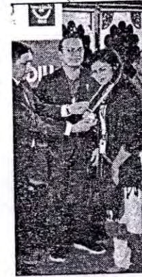
ই ডিসেম্বর অনুষ্ঠিত হয় সন বিভাগের উদ্যোগে ও আঞ্চলিক বিশ্ববিদ্যালয়ের নী অনুষ্ঠানে প্রধান অতিথি ল আমিন ও বিশেষ অতিথি ' এর ব্যবস্থাপনা পরিচালক বিশ্ববিদ্যালয়ের ভারপ্রাপ্ত ভিসি ঠানে আরো উপস্থিত ছিলেন ল, বাণিজ্য ও উদ্যোক্তাবৃত্তি া, ব্যবসায় প্রশাসন বিভাগের শুমুখ। বিজ্ঞপ্তি