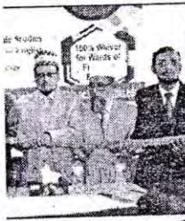
হলো বাংলাদেশ ইসলামী র-২০২০। বিশ্ববিদ্যালয়ের ট ফেয়ারের উদ্বোধন করেন জর চেয়ারম্যান অধ্যাপক তত্ব করেন বিশ্ববিদ্যালয়ের । বিজ্ঞপ্তি